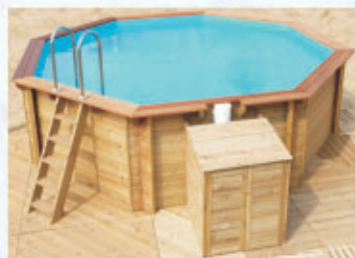
basen okrągły 240 (średnica zewnętrzna 5,9 m)

Dostępne są trzy modele, zestawione zostały w cztery warianty wyposażenia: