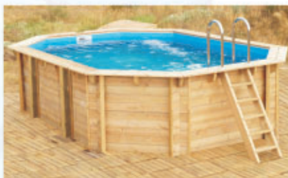
basen podłużny 550 (wymiary zewnętrzne 4 x 5,5 m)