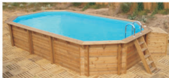
basen podłużny 700 (wymiary zewnętrzne 4 x 7 m)