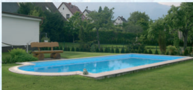
Basen TEBAS POLIMER Folia Alkorplan 2000* wzory do wyboru: